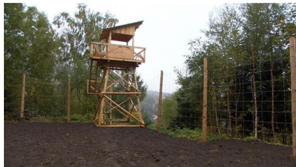
Replika komunistického lágru 50. let.